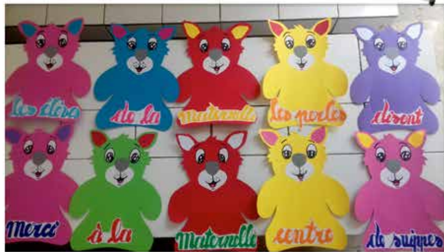
Equipe pédagogique de l'école maternelle les Perles.