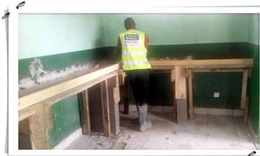
Réalisation du plan de travail