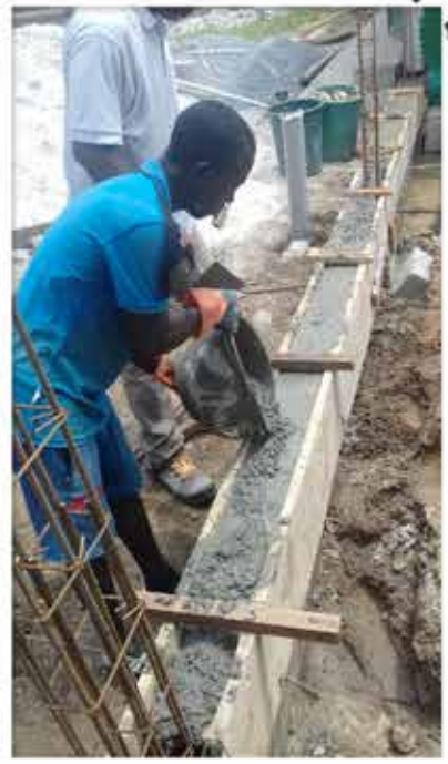
Coulage du béton