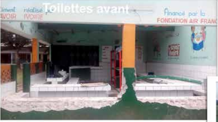
Démolition du mur