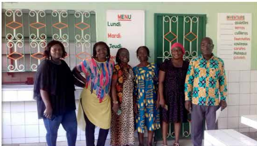
Équipe pédagogique de l'école la Colombe.