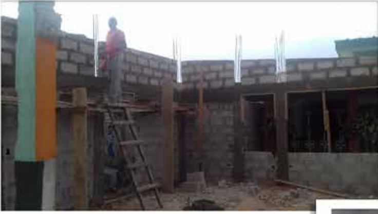
Élévation des murs